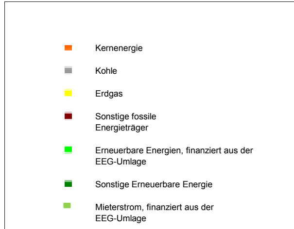
Stromerzeugung 2018 in Deutschland - Durchschnittswerte zum Vergleich