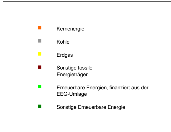
Stromerzeugung 2016 in Deutschland - Durchschnittswerte zum Vergleich